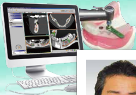
Surgical Guide System